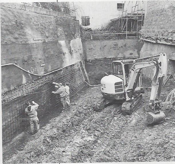
Tiefbau für Aufzugsturm

Der Weltgästeführertag am 2. März 2019 steht unter dem Motto „BAU-einHAUS“. Das Hölderlinjubiläum ist schon im kommenden Jahr!